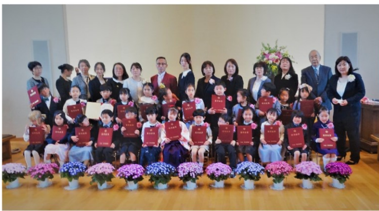
卒園証書を手にして記念写真